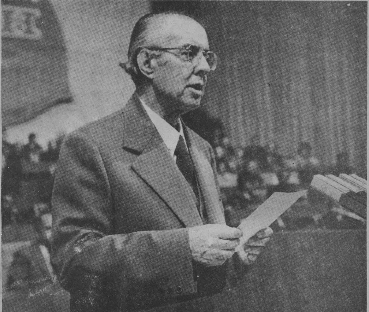
ਐਨਵਰ ਹੋਜ਼ਾ ਪਾਰਟੀ ਆਫ ਲੇਬਰ ਆਫ ਅਲਬਾਨੀਆਂ ਦੀ ਕੇਂਦਰੀ ਕਮੇਟੀ ਦੇ ਮੁੱਖ ਸਕੱਤਰ